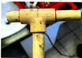
Le tuyau fendu.