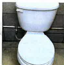
Le tuyau neuf à gauche fait contraste avec l'autre bout à droite qui n'a pas fendu.