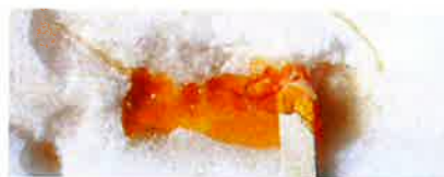
Miam!!! De la bonne tire sur la neige