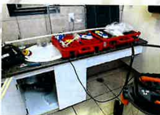
Le nettoyage des dégâts d'eau avant de faire les travaux.

Durant les camps, il y a plusieurs choses qui se produisent et l'une d'elles a été une porte ou une fenêtre laissée ouverte dans le bloc sanitaire entraînant le gel d'un bout de tuyau et les dégâts qui vont avec.