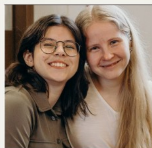
Et plusieurs bonnes amies !

Quelle plaisir, émotion et fierté de clore l'année avec toutes ces personnes que j'ai côtoyées pendant un an, certaines deux !