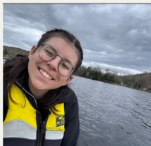
Sur le lac Lovering !