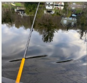
Un peu de pêche avec des amies !

Dans les dernières semaines, le Camp Livingstone nous a prêté son terrain pour qu'on profite de la nature en groupe et d'un moment de relaxation !