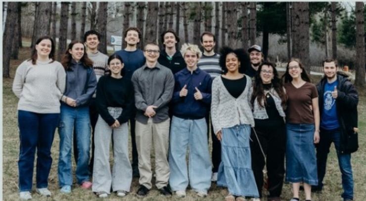
NOTRE ÉQUIPE !