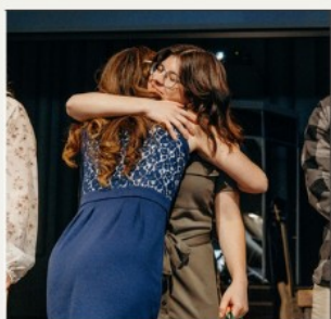
Ma chère conseillère qui m'a accompagnée et encouragé toute l'année

Quelle plaisir, émotion et fierté de clore l'année avec toutes ces personnes que j'ai côtoyées pendant un an, certaines deux !