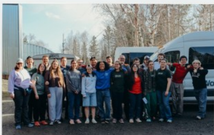
Notre équipe avec celle d'Owen Sound

Nous sommes arrivés vendredi soir en vue du ralliement jeunesse organisé le samedi suivant. Lors de cet événement, nous avons œuvré avec les étudiants de Word of Life Owen Sound, notre campus en Ontario !