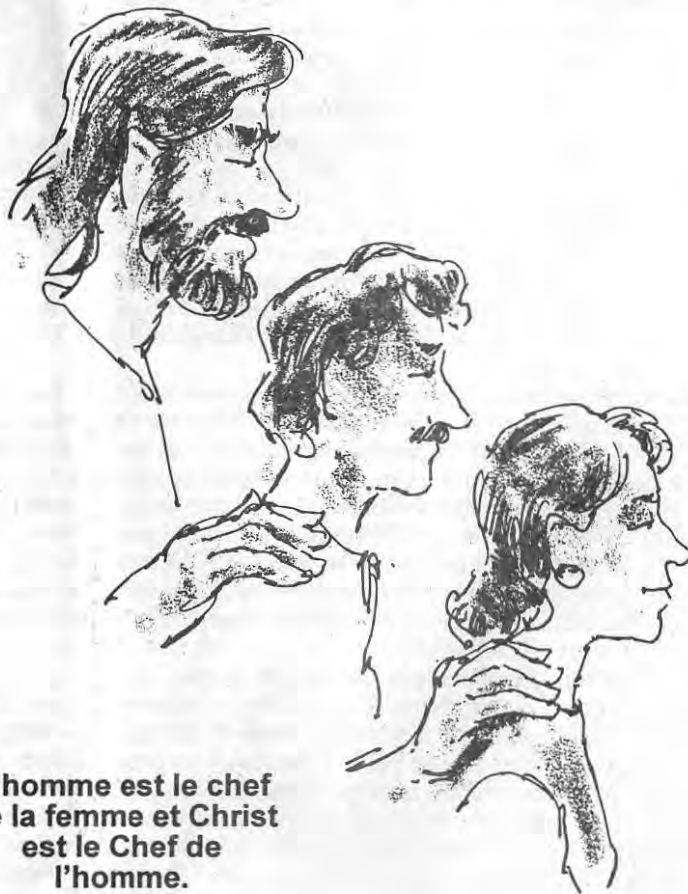
L'homme est le chef de la femme et Christ est le Chef de l'homme.

L'ordre de l'autorité de Dieu a commencé par