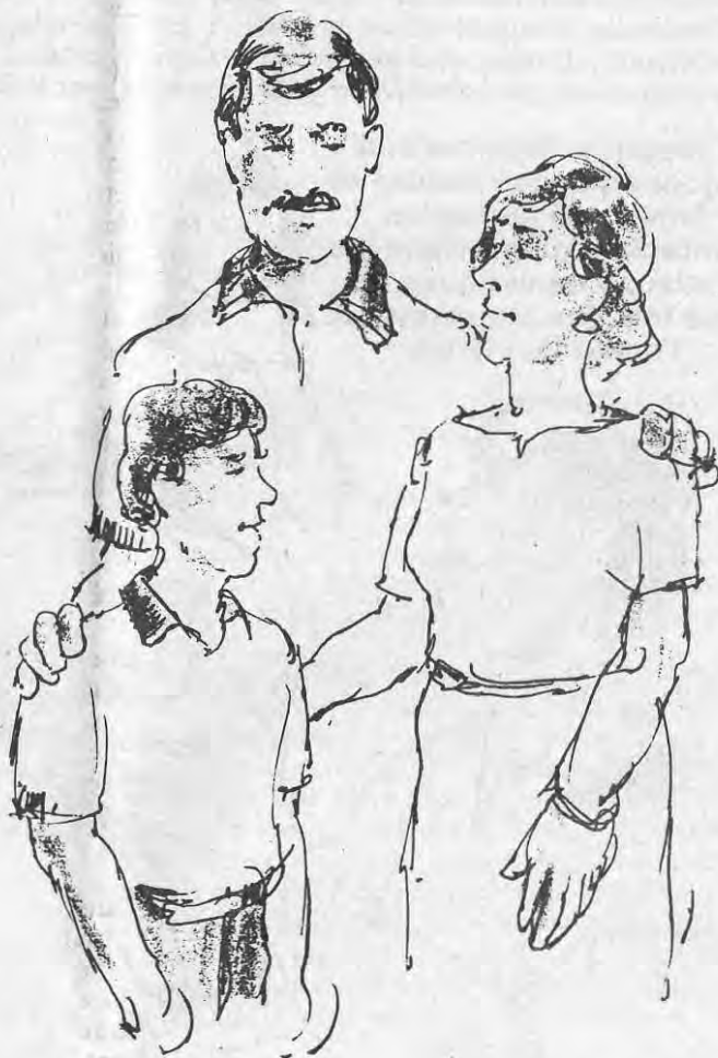
La famille d'un homme cherchera en lui le support et la protection dont elle a besoin.

Dieu a accordé au mari l'autorité d'être le chef de sa famille (Éphésiens 5 : 23). Cette autorité doit toujours être employée pour le bien de son épouse et ses enfants. Il ne DOIT PAS s'en servir pour ses propres désirs égoïstes. Le mari n'est pas un dictateur ni un tyran qui exige l'obéissance à chacun de ses petits souhaits. Son épouse et ses enfants ne sont pas ses esclaves ni ses possessions. Ils appartiennent à Dieu et l'époux est chargé de « régner » ou « dominer » sur sa famille comme un bon serviteur (Luc 12 : 42) des choses qui appartiennent à