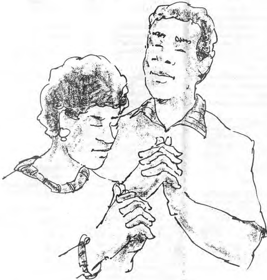
Le femme regarde à l'homme et l'homme regarde à Dieu.